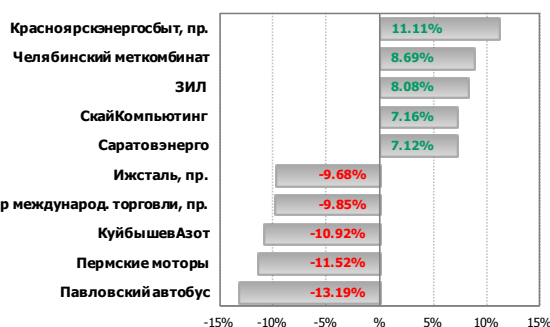
Лидеры и аутсайдеры недели в ММВБ