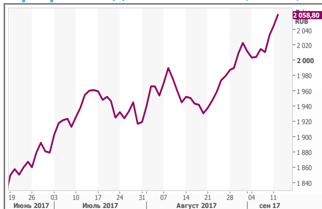
График индекса ММВБ (60 мин.)

Макроэкономические события: промышленное производство в еврозоне (12 мск). Запасы нефти от EIA (17:30 мск). Прогноз: +3,24 млн.